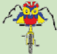
Mussols del Pedra