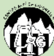
Centre Alpi Gironella